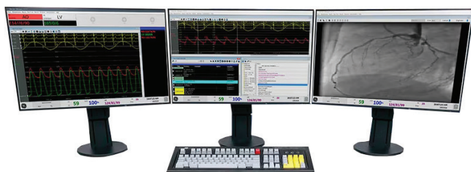
Mesures hémodynamiques MAC-LAB BT22