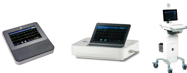
Échocardiographie au repos: MAC5 - MAC7 - MACVU360