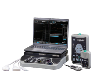
EMG - PE - Echographie Cadwell Sierra Summit