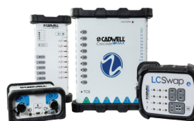
Surveillance neurophysiologique peropératoire Cascade IOMAX