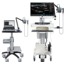
Electrodiagnostic sur PC portable ou bureau