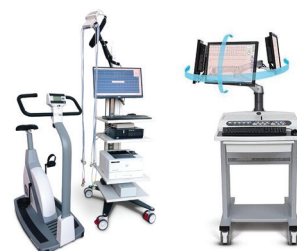
Échocardiographie de stress : eBIKE III avec CARDIOSOFT - CASE