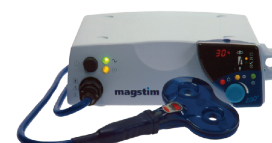
Simulation magnétique Magstim