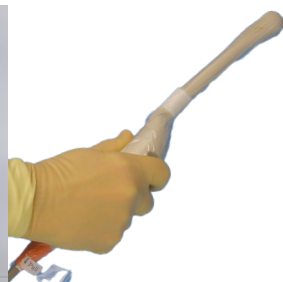
Beschermhoezen voor ultrasound transducers en probes