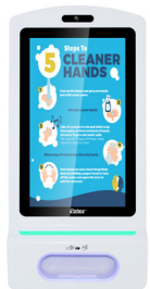
Totems voor handhygiëne