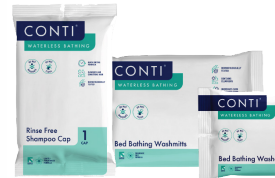
Wassen zonder water