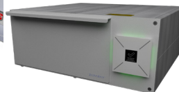
Standaard desinfectie van hulpmiddelen