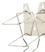
Roestvrijstalen dispensers voor flacons