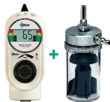
Système de contrôle de l'aspiration