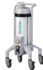
Système de gestion d'aspiration chirurgicale