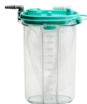
Systèmes de collecte