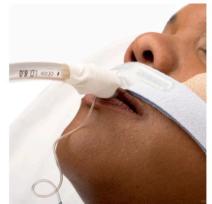
Fixateur de tube endotrachéal