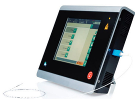
Procédure laser mini-invasive