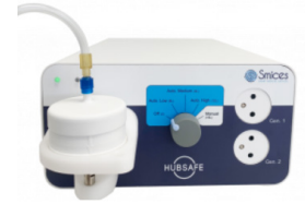
Gestion de la fumée