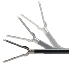
Instruments lap. orientables