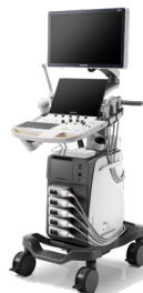
Endo Echo (EUS – EBUS)