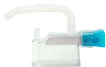
Hygiëne & Desinfectie