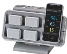
Utilisation à l'hôpital