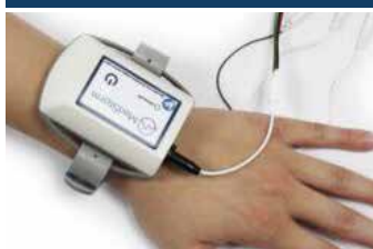
Moniteurs de la douleur