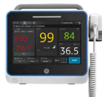
Moniteurs de signes vitaux