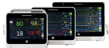
Moniteurs de Performance