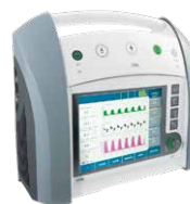
Ventilation des nouveaux-nés