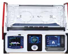
Incubateur de transport