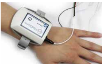
Moniteur de la douleur