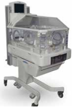
Incubateurs et lits chauffants