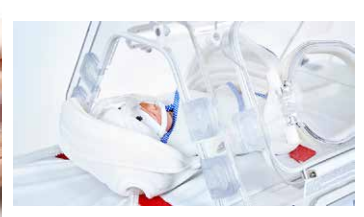
Systèmes de retenue néonatale