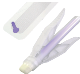
Skin closure system