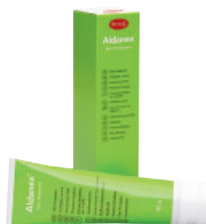
Preventie en behandeling van vochtletsels