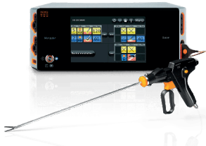
Toestel voor electrochirurgie