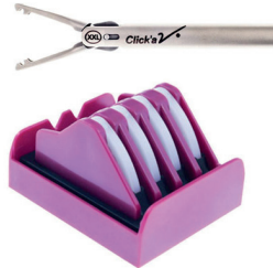
Polymere ligatie clips