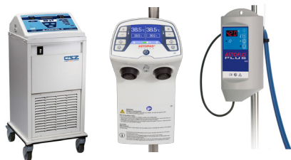
Patiënt Temperatuur Management