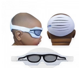
Moeder kind zorg