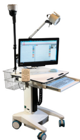
EEG & LTM