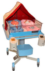
BabyBed & BabyWarmer