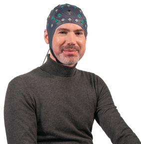
Accessoires & benodigheden