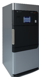
Lage Temperatuur Sterilisatie