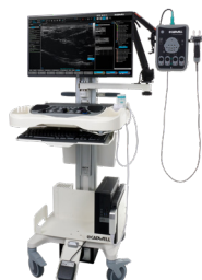
EMG & EP