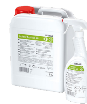
Reinigings- en desinfectiemiddelen