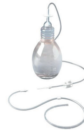
Système de cathéter PleurX