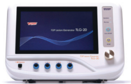
Thérapie par radiofréquence