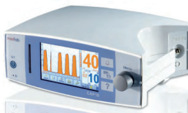
Surveillance par capnographie