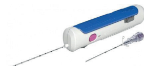
Instruments et aiguilles de biopsie