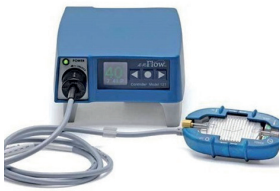
Réchauffeur de sang et de solutés