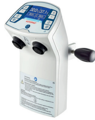
Systèmes de réchauffement des patients