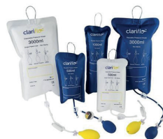
Poches sous pression pour perfusion