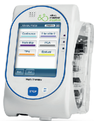
Pompe à perfusion