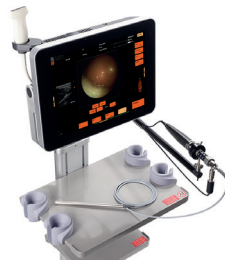
Micro-endoscopie guidée par ultrasons