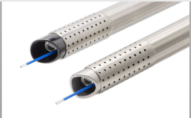
oben: Dauerspül-Laser-Resektoskopschaft mit Keramikspitze unten: Dauerspül-Enukleationsschaft mit Edelstahlspitze