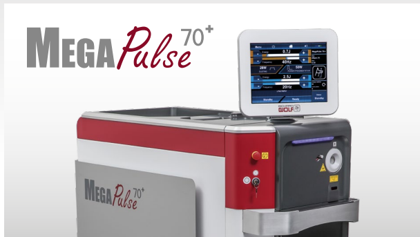
MegaPulse 70+ Holmium:YAG Laser