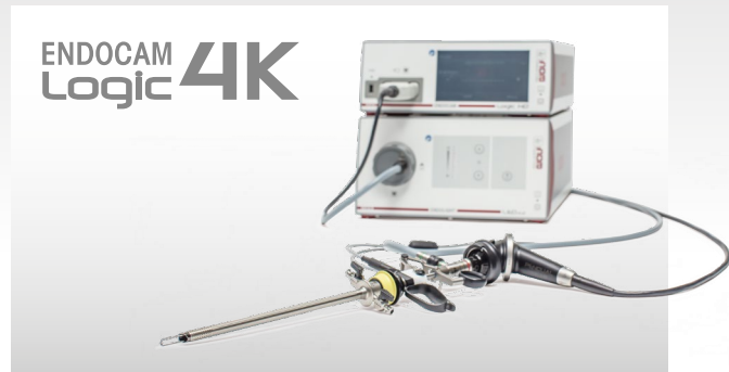
ENDOCAM Logic 4K

Weitere Laserfasern für andere Anwendungen finden Sie im Urologie-Katalog.