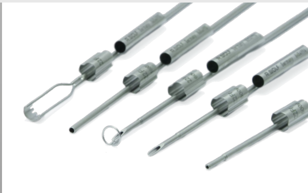
Große Auswahl an Laser-Führungsrohren