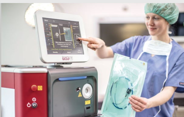
MegaPulse 70+: Power. Flexibility. Usability. 70 W Holmium:YAG Laser-System