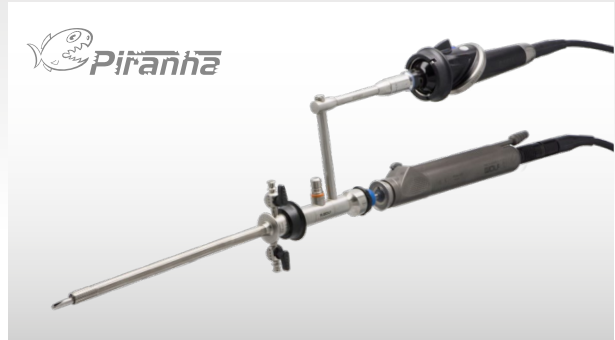
Morcescope, 0° in Kombination mit SHARK Außenschäften