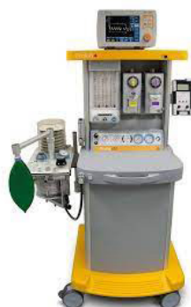
Ventilateur d'anesthésie MRI