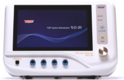
Thérapie par radiofréquence