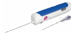
Instruments et aiguilles de biopsie