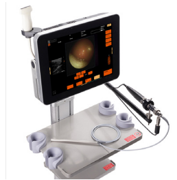
Micro-endoscopie guidée par ultrasons