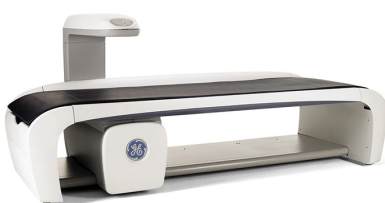
BMD: Bone Mineral Density