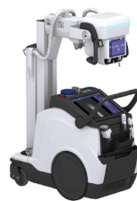
Systèmes mobiles de rayon X