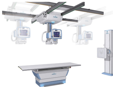
Salles de rayons X