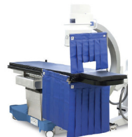
Matériel de radioprotection