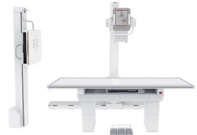
Systèmes au sol