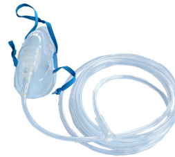
Zuurstof & aerosol therapie