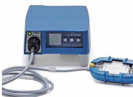
Bloed- en vloeistof- verwarmer