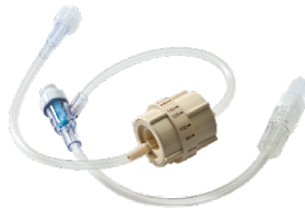
Régulateur de débit