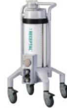
Système de gestion d'aspiration chirurgicale