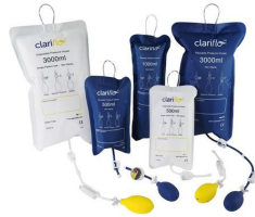
Poches sous pression pour perfusion