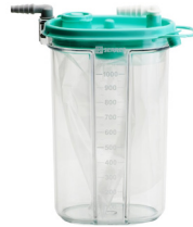
Systèmes de collecte