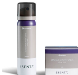
Retrait d'adhésifs médicaux