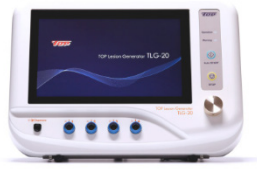
Thérapie par radiofréquence