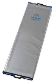
Transfert des patients