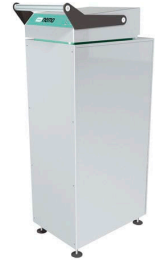
Dispositif de vidange des poches d'aspiration