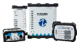
Surveillance neuro-physiologique peropératoire Cascade IOMAX