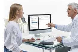
SentrySuite: Gestion des Informations Clinique