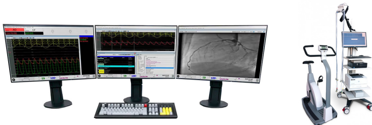
Mesures hémodynamiques MAC-LAB BT22 & Procédures électrophysiologiques CARDIO-LAB BT22 avec CARDIOSOFT - CASE