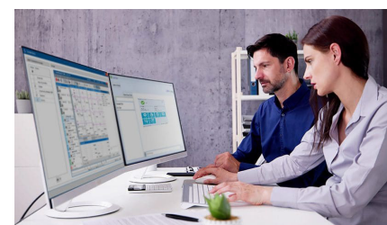
Cadlink: Gestion des Informations Clinique