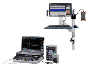
EMG – EP – Ultrasound EEG – LTM – ICU Cadwell