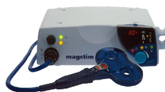
Simulation magnétique Magstim