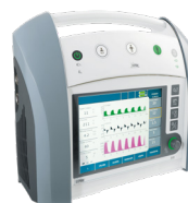
Ventilation des nouveaux-nés