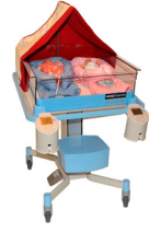
BabyBed & BabyWarmer