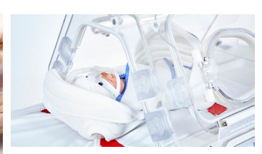
Systèmes de retenue néonatale