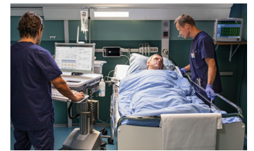
Centricy Neonatal Critical Care