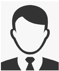
Open Position Account Manager CE Sud-Ouest