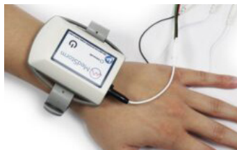
Moniteur de la douleur