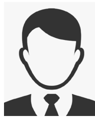
Open Position Account Manager CE Sud-Est