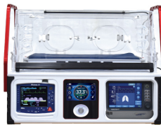
Incubateur de transport