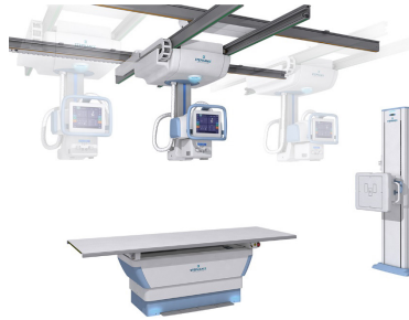
Salles de rayons X