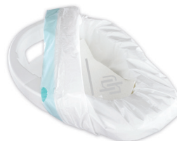
Opvangsystemen voor excreties