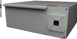
Standaard desinfectie van hulpmiddelen