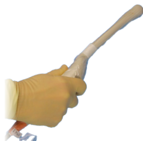
Beschermhoezen voor ultrasound transducers en probes