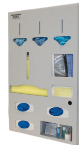
Dispensers voor isolatiekamers