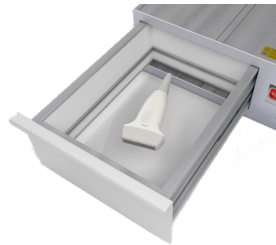
Gecontroleerde desinfectie van hulpmiddelen