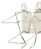
Roestvrijstalen dispensers voor flacons