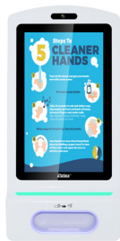
Totems voor handhygiëne