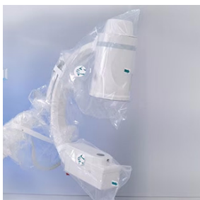
Beschermhoezen voor microscopen, C-armen en robots